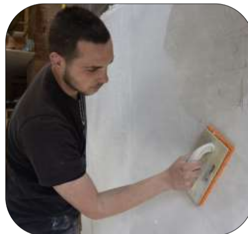
Talochage du plâtre