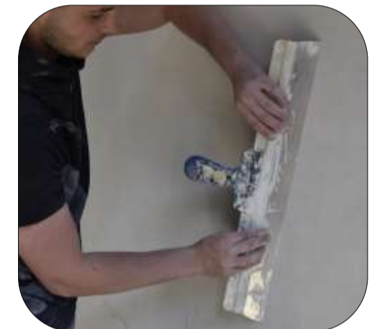
Lissage au couteau