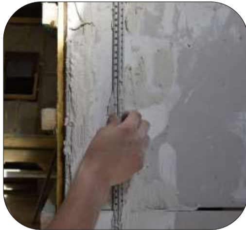
Pose de guide