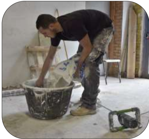
Préparation du plâtre

C'est une personne qui intervient dans le parachèvement en plâtrant les murs intérieurs de nouvelles constructions, de rénovations ou de réparations dans des bâtiments plus anciens. Ce travail est réalisé en suivant les règles de mise en œuvre en réalisant les mélanges dans des cuvelles ou en utilisant une projeteuse.