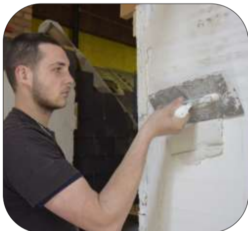
Gâchage du plâtre