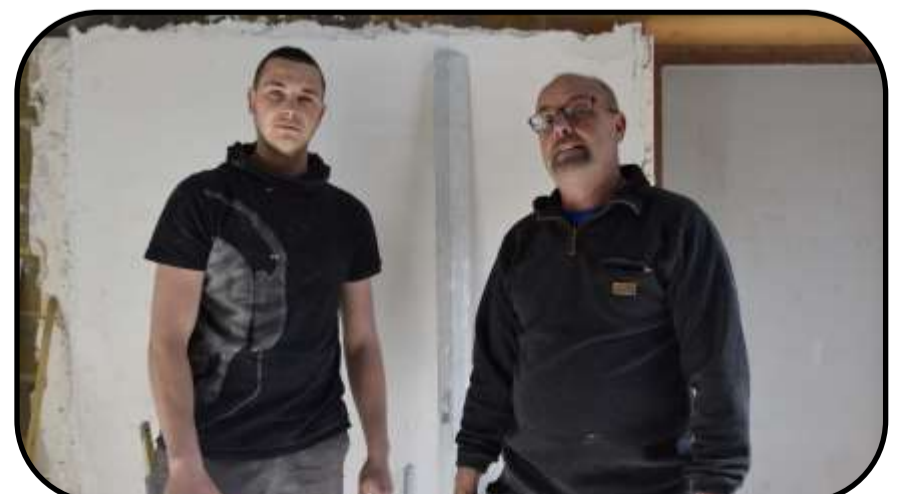
Fiche réalisée par l'élève de la classe « Plafonneur » du CEFA en 2016-2017