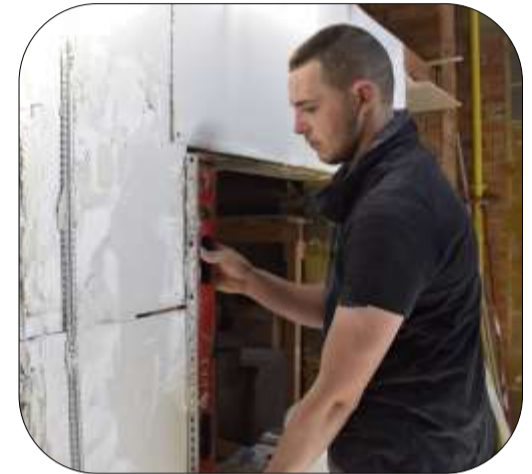
Vérification de la cornière au niveau