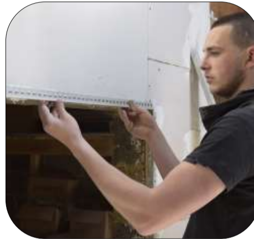
Pose de cornière