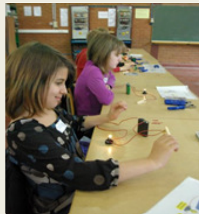
Raccorder une lampe