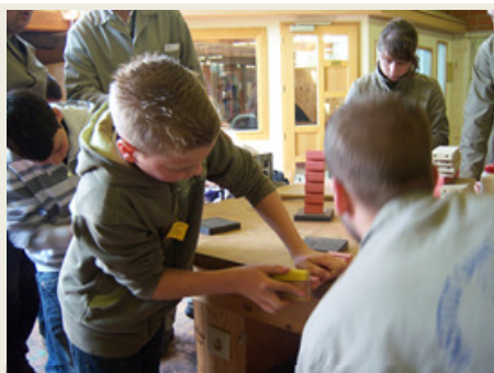
Monter un porte CD en bois

Pour la 3 e année, nous travaillons en partenariat avec l'Instance de Pilotage Interréseaux de l'Enseignement Qualifiant (I.P.I.E.Q.) de la zone Mons-Centre pour la sensibilisation aux métiers du qualifiant.