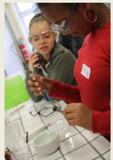
Manipuler en laboratoire