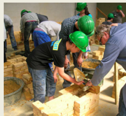
Construire un mur

Des élèves du 1 er degré issus d'établissements exclusivement d'enseignement général peuvent participer aux journées des métiers via inscription auprès de l'I.P.I.E.Q.