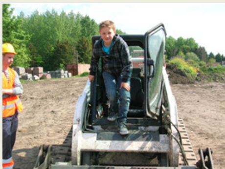
Conduire un engin de chantier